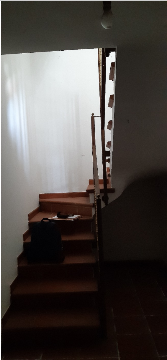
Figura 27 - arrivo scala al piano interrato