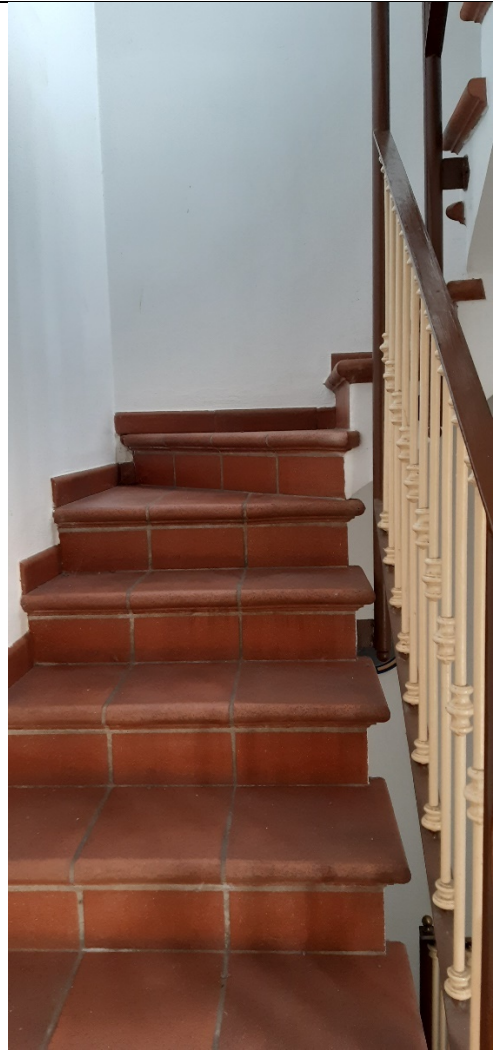
Figura 19 - scala di distribuzione al piano superiore