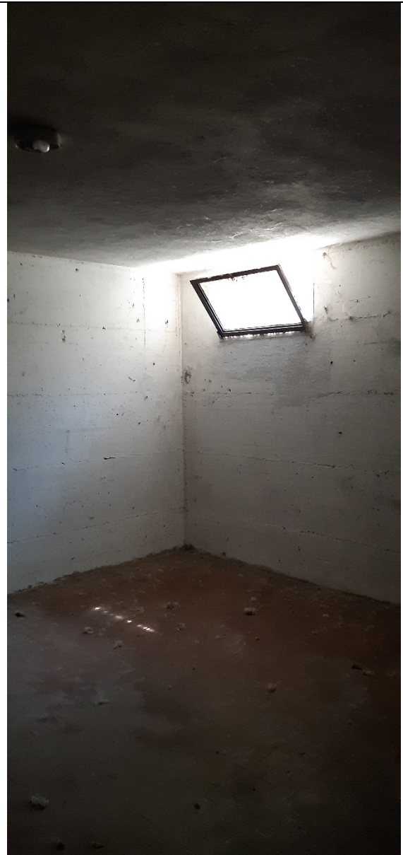
Figura 28 - locale piano interrato