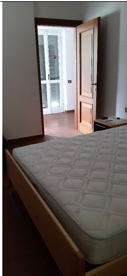
Figura 26 - camera piano primo