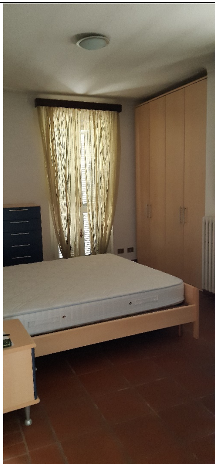
Figura 25 - camera piano primo