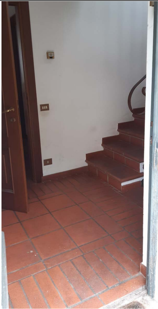
Figura 18 - ingresso