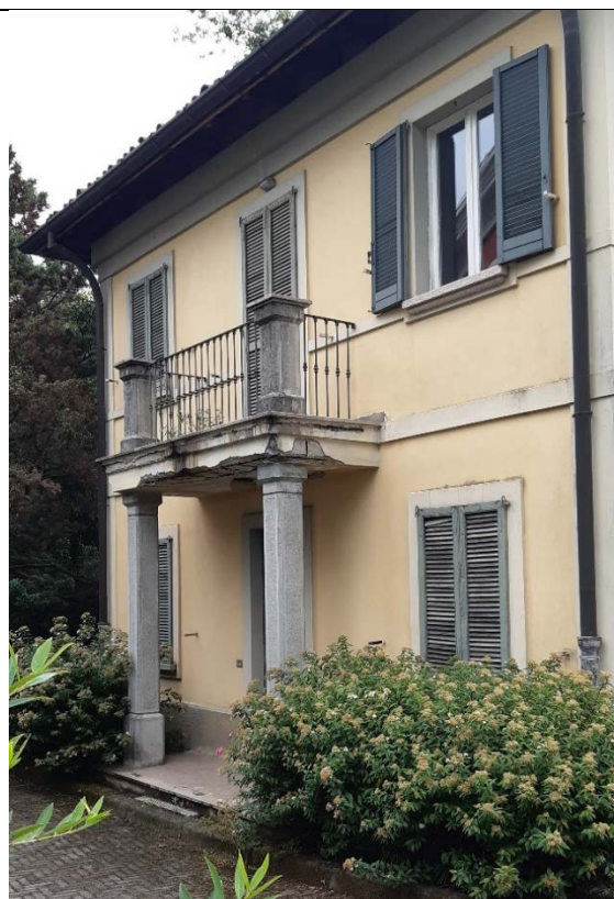
Figura 16 - dettagli stato di manutenzione portico di ingresso