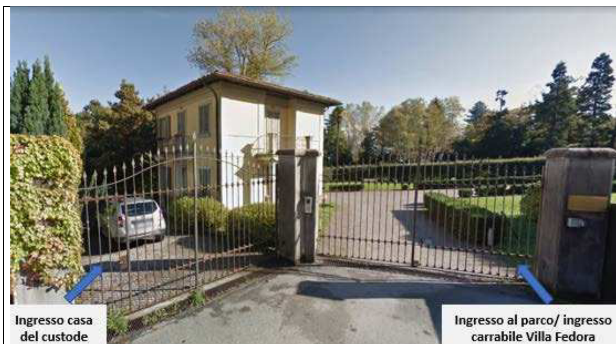
Figura 5 - ingressi

Gli spazi oggetto di richiesta di alienazione sono quelli individuati alla lettera E, più precisamente indicati nelle planimetrie seguenti.