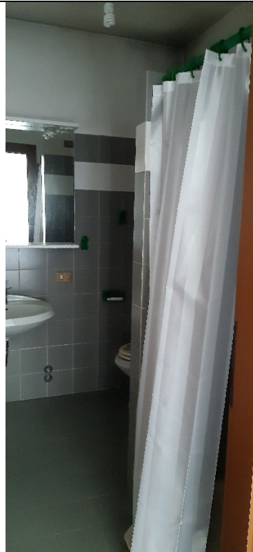
Figura 24 - servizio igienico