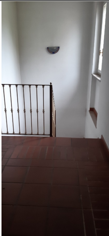
Figura 23 - primo piano, pianerottolo