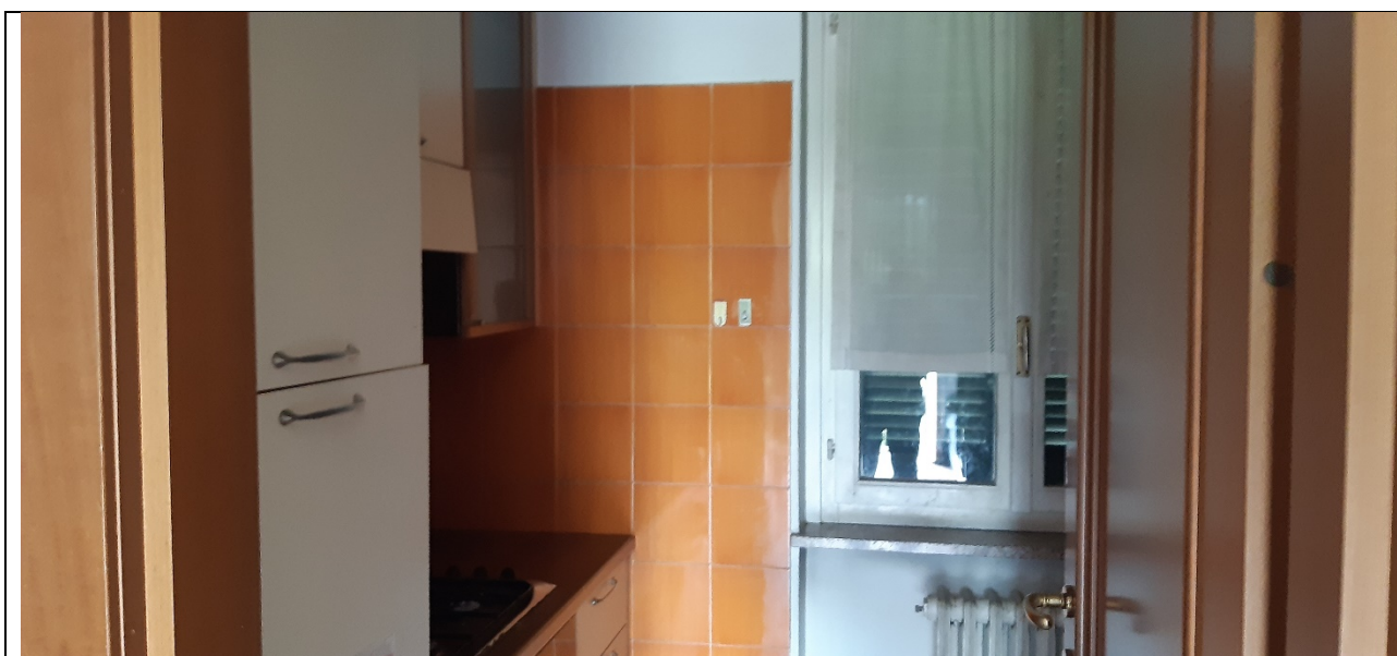
Figura 22- cucinino