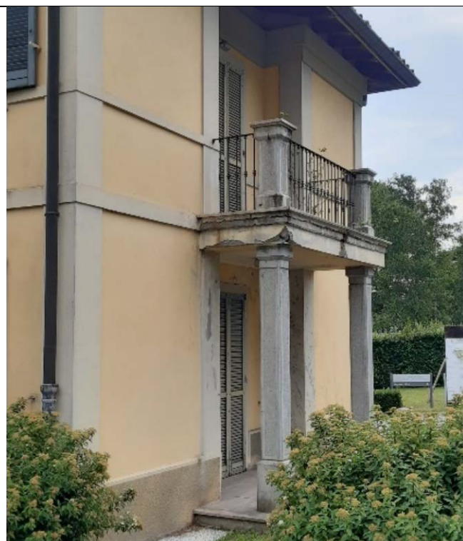
Figura 17 - dettaglio stato manutentivo portico fronte giardino