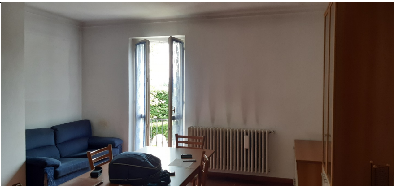
Figura 20 - piano terra locale principale