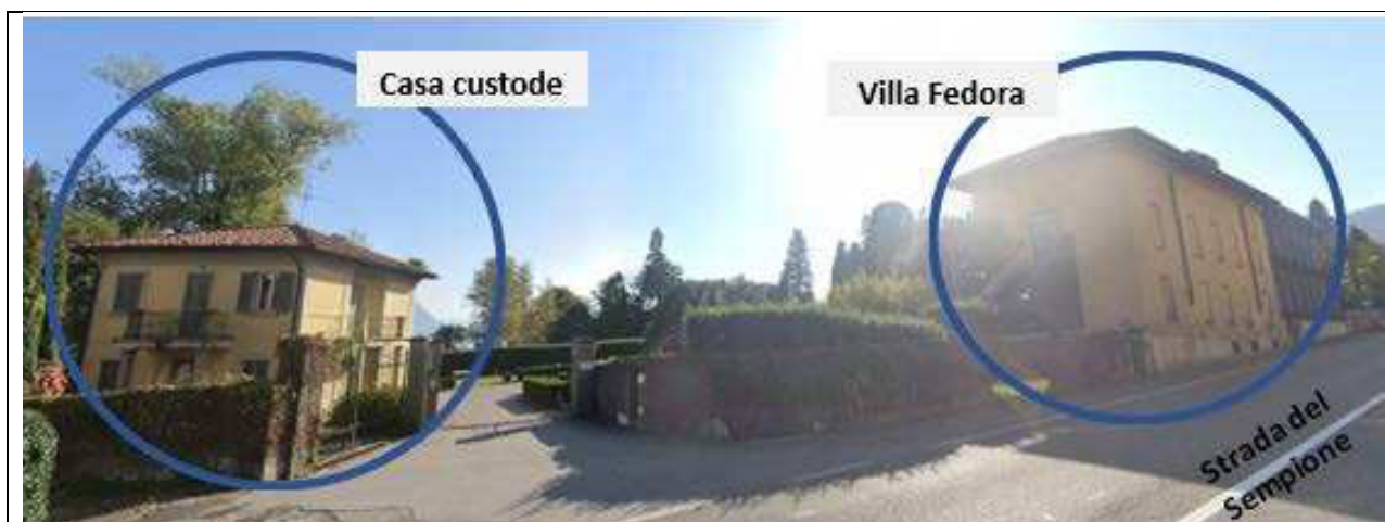
Figura 4 - ubicazione delle due proprietà su strada del Sempione