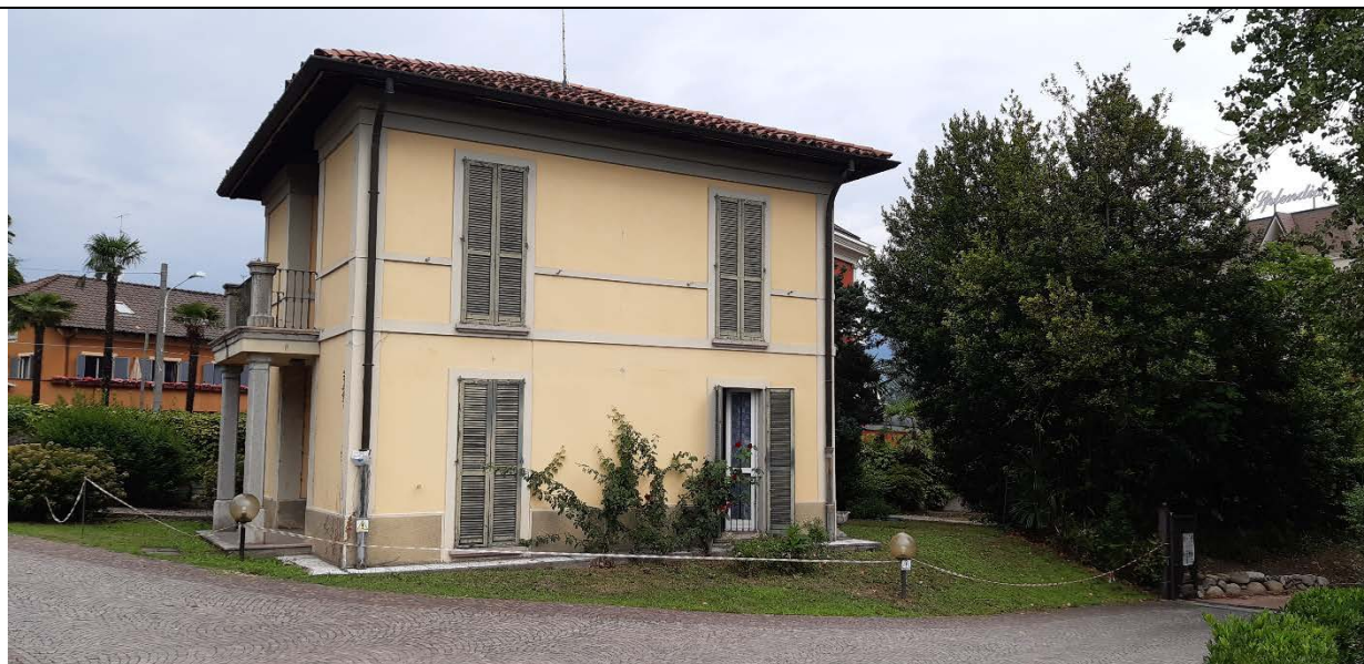
Figura 15 - vista casa del custode dal parco