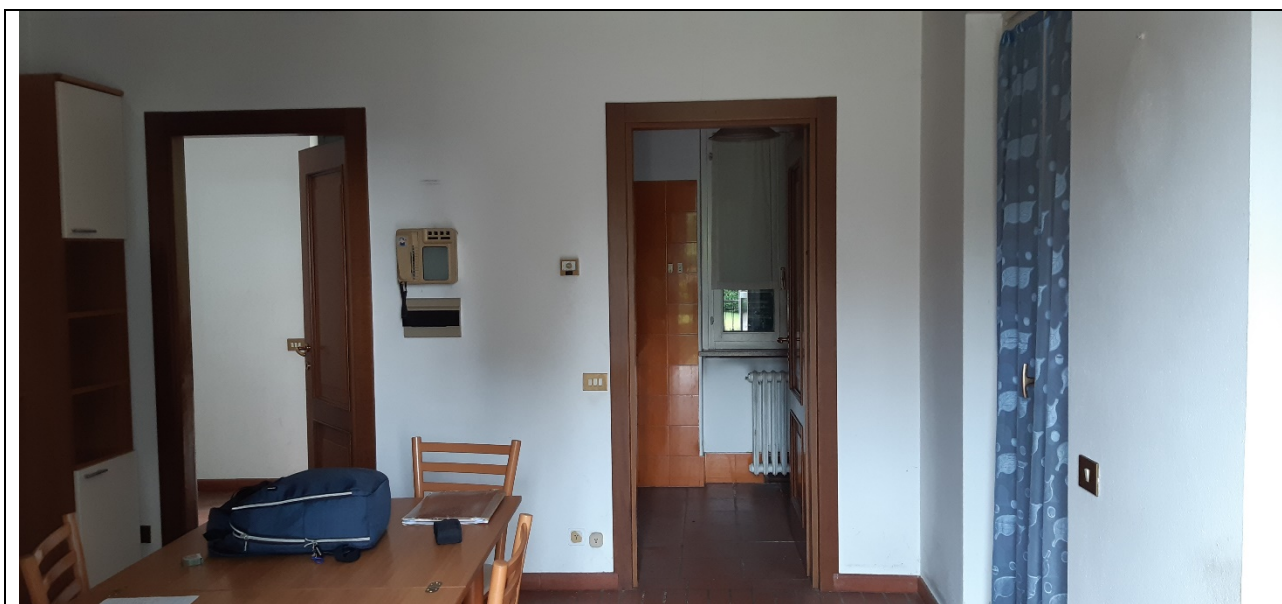
Figura 21 - locale principale, vista cucinino e ingresso